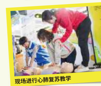
现场进行心肺复苏教学