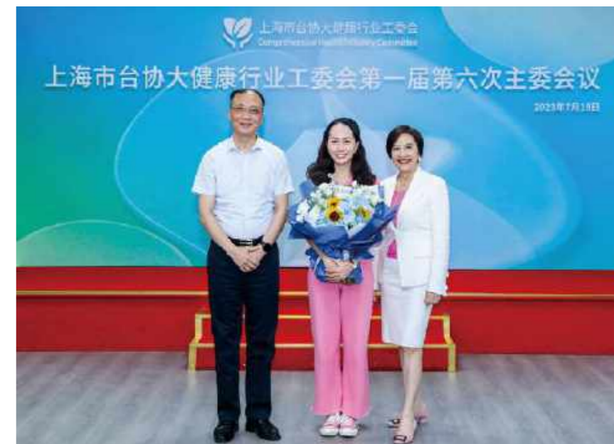
上海市台办副主任王立新见证史家怡副主委辞任献花仪式