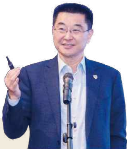
鲁翔 江苏省医院协会会长

5月7日，江苏省医院协会会长、南京医科大学附属逸夫医院党委书记鲁翔出席“强医院 护公益 惠社会——健康中国·医院发展和运营管理高峰论坛”第一期，并作《管理创新与医院高质量发展》的主题分享。