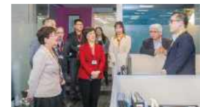
上海市委统战部常务副部长黄红与公司青年交流

访表示欢迎，感谢市委统战部及徐汇区委、区政府长期以来对合富的关心与支持。她指出，合富深耕大陆20余年来，始终坚持以创新和服务为本，赋能医院发展及管理，与医院客户共同构建优质的医疗环境。作为目前唯一两岸上市的医疗企业，合富将持续发挥桥梁纽带作用，义不容辞地为两岸医疗发展贡献力量。她表示，