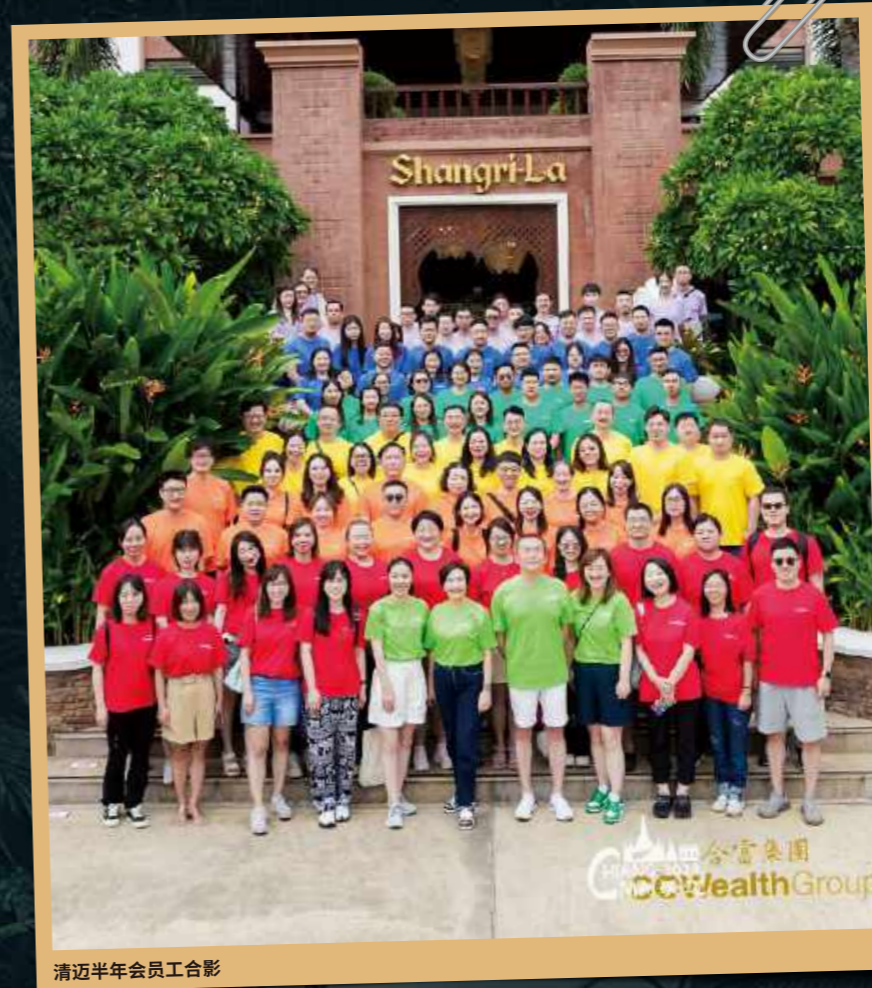
清迈半年会员工合影