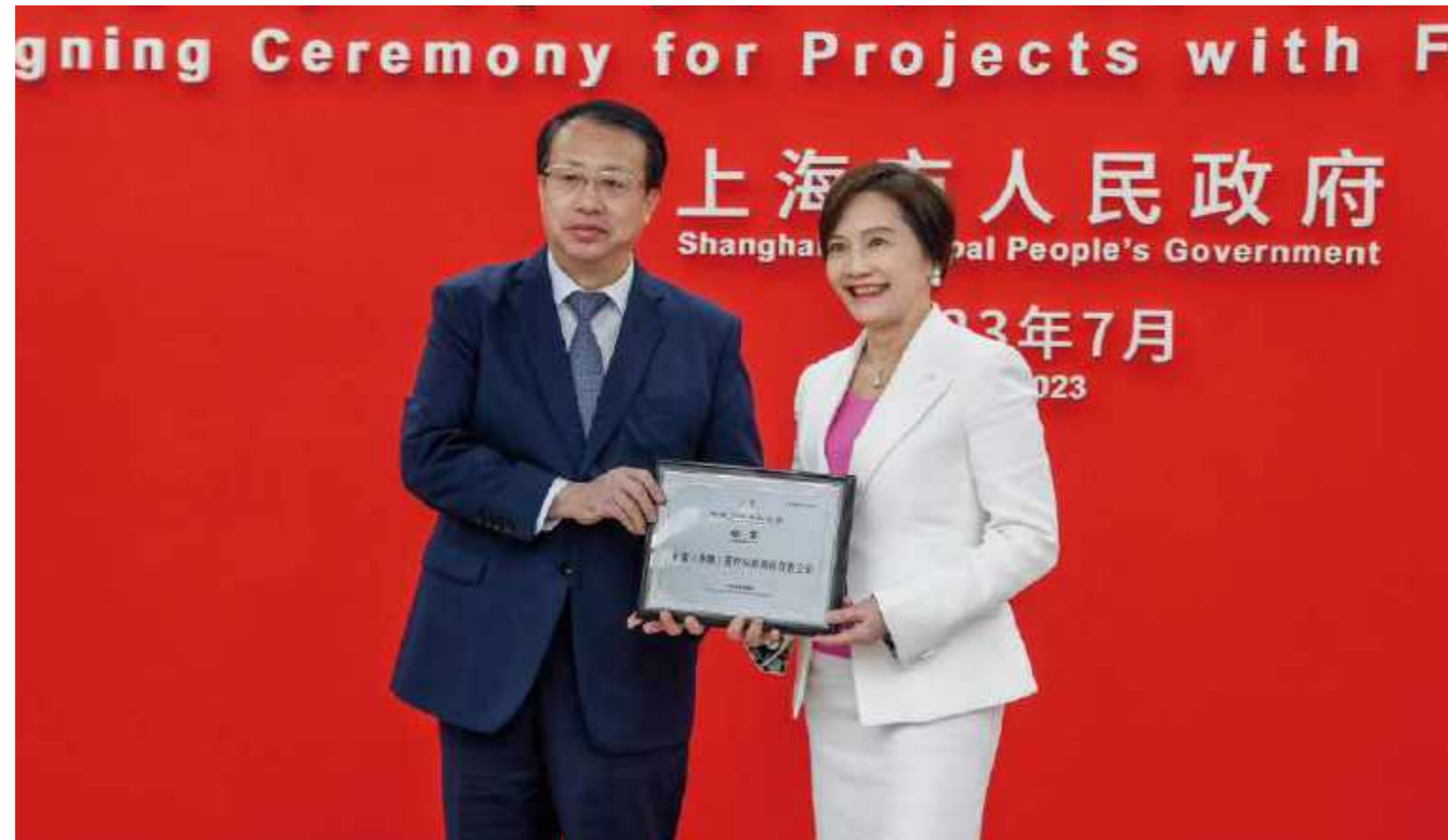
上海市市长龚正为合富集团董事长王琼芝颁发证书

7月18日,第三十七批跨国公司地区总部和研发中心颁证暨上海市外资项目集中签约仪式在上海举行。上海市市长龚正为跨国公司地区总部和研发中心颁证并见证签约。新认定的31家跨国公司地区总部和13家研发中心获颁证书;77个外资项目集中签约,投资总额达到102.4亿美元。