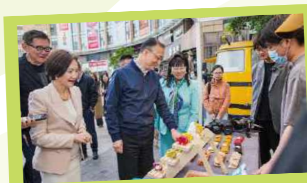
上海市台办副主任王立新参观市集展品

此次活动搭建知名台企与创业台青合作交流的平台, 支持台青创业就业的同时也为台资商品重新灌注活力年轻的品牌形象, 今天我们也荣幸邀请到六家在沪台企发布台青项目, 提供台青展示才华的舞台。