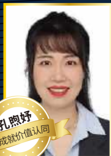
孔煦好 AV-成就价值认同