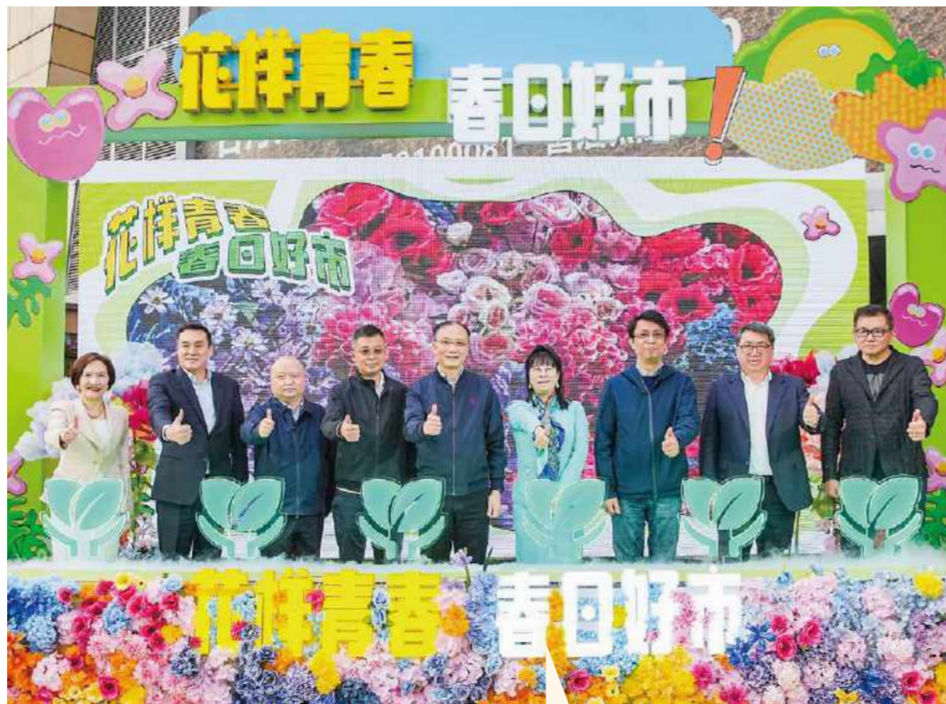
与会领导共同为活动启幕

2023年4月27日-5月3日, 在上海日月光中心展开为期七天的“花样青春 春日好市”市集活动。本次活动由上海市人民政府台湾事务办公室、上海市台湾同胞投资企业协会、上海市黄浦区人民政府台湾事务办公室指导举办, 由上海市台协大健康行业工委及上海市台协黄浦区工委联合主办, 质成文化传播(上海)有限公司承办, 上海日月光中心协办。本次活动为在沪创业台湾青年打造崭露头角、宣传品牌的平台, 举办融合市集、台青创业、大健康及文创概念于一体的互动式体验市集。搭建知名台企与创业台青合作交流的平台, 支持台青创业就业的同时也为台资商品重新灌注活力年轻的品牌形象。