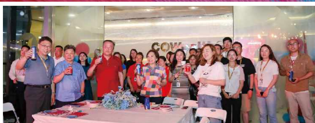
合富员工共庆集团26周岁生日快乐