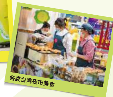
各类台湾夜市美食