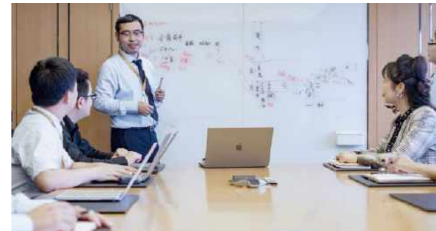
合富医院精细化管理团队召开会议

在创新原有SPD业务的基础上，合富中国积极响应国家对于公立医院运营管理要求的政策，以提升医疗机构精细化管理为抓手，进一步整合两岸医疗资源，创新研发拥有自主知识产权的医院科室运营管理软件，并配合软件的使用推出医院科室运营管理的辅导服务，为医院提质增效，以授人以渔的方式协助医院培养科室运营管理的种子团队，落实科学化、精细化的管理，助力科室和医院效益迈上新台阶。