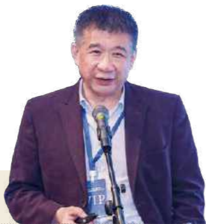
黄力 广东省医院协会会长

5月7日，广东省医院协会会长黄力出席“强医院 护公益 惠社会——健康中国·医院发展和运营管理高峰论坛”第一期，并发表《新形势下供给侧改革与公立医院高质量发展》的主题分享。