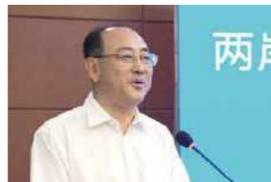
潍坊市卫健委主任张晓乙致辞

望与台湾健康领域方面深入开展更大格局、更高层次、更宽领域的务实合作，积极连接优质资源，实现更大程度的共赢发展。