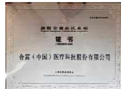
“跨国公司地区总部”证书

务委认定的市级荣誉,是上海市政府推动更深层次、更宽领域、更大力度开放的重要举措。认定为跨国公司地区总部的企业,可在贸易便利、科技创新支持、商事登记、项目投资、人才引进、出入境便利、知识产权保护等方面获得政府的大力支持。