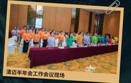
清迈半年会工作会议现场