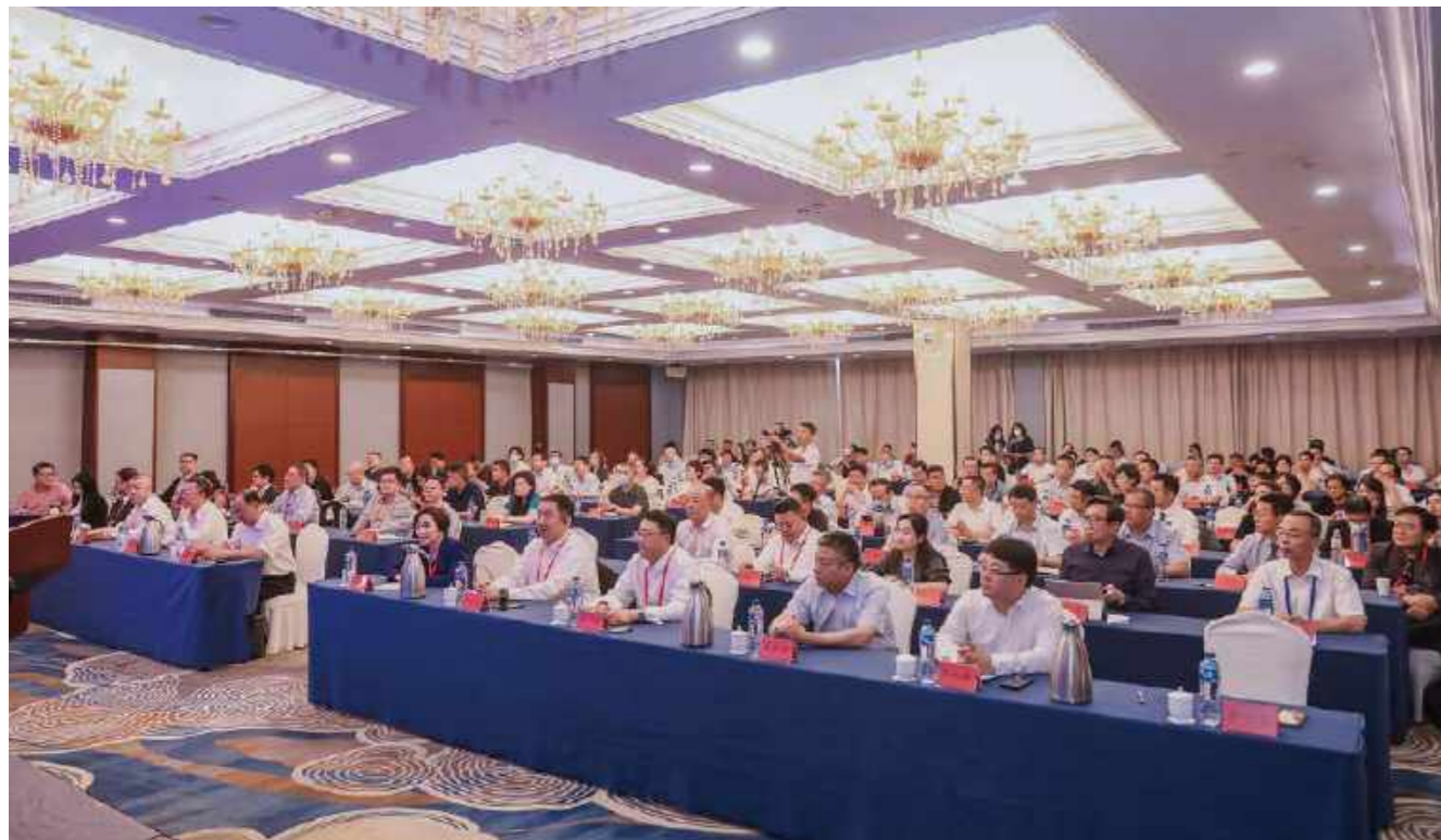
两岸医院运营管理和健康产业发展论坛现场

9月2日下午，“两岸医院运营管理和健康产业发展论坛”在第27届鲁台经贸洽谈会暨2023台商大会期间举行。本次论坛由山东省卫生健康委、山东省台港澳办、潍坊市人民政府主办；潍坊市卫生健康委、潍坊市台港澳办承办；合富医疗集团、台湾大健康产业联盟协会协办。