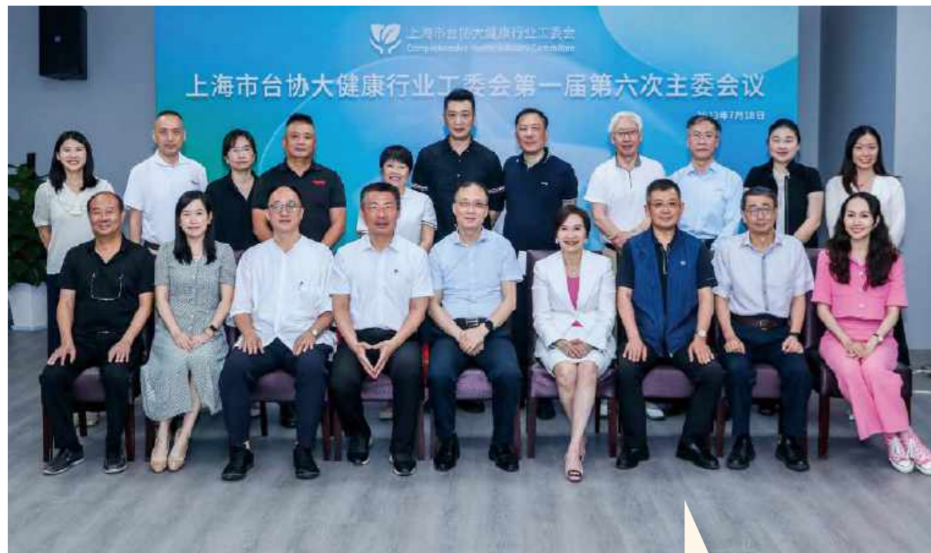
与会人员合影留念

7月18日,上海市台湾同胞投资企业协会大健康行业工作委员会(以下简称“台协大健康”)于上海市漕河泾现代农