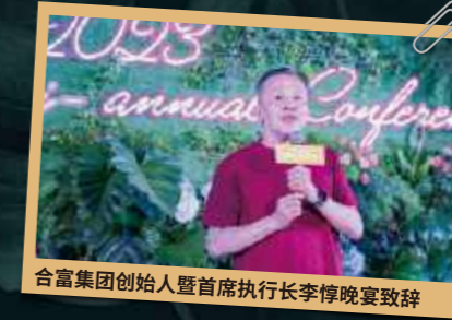
合富集团创始人暨首席执行官李惇晚宴致辞