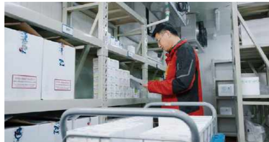
合富员工在物流中心作业

有别于传统SPD供应商，合富中国能为医疗机构的不同需求提供定制化的服务方案，有效降低医疗机构采购成本的同时，也能够保持自身供货产品选择的灵活性。